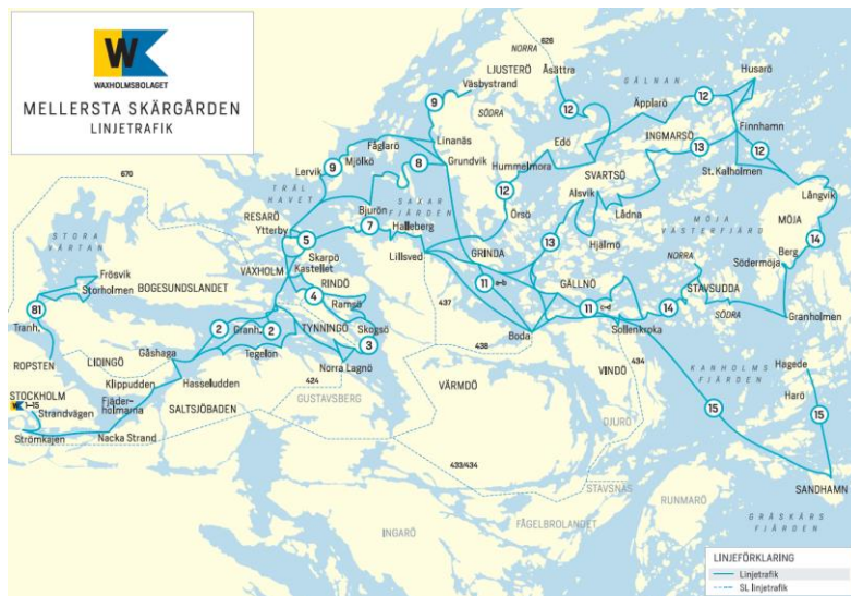
Bild. Linjekarta på mellersta skärgården