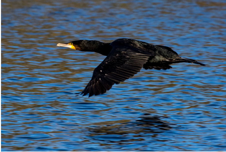
Flygande skarv.

För att se effekterna av olika fiskevårdande åtgärder används provfisken. Det är den metod som har bäst förutsättningar att följa fiskbestånd och därmed möjlighet att se mönster och förändringar över tid. Under senare år har Länsstyrelsen samlat in viktiga data från många olika lekområden på kusten, vilket kan komma till användning för framtida uppföljning. Länsstyrelsen arbetar även med att öka antalet provfisken inom ramen för den nationella kustmiljöövervakningen.