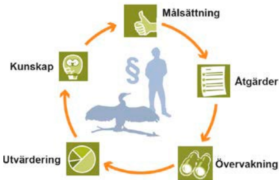
Figur 1. Schematisk bild över den adaptiva förvaltningen 1 .

Förvaltningen av skarv ska, som all viltförvaltning, vara adaptiv. En adaptiv och flexibel förvaltning definierar först mål för de områden som ska förvaltas. I nästa steg genomförs planerade åtgärder. Under förvaltningsarbetet sker en löpande övervakning av utvecklingen och justeringar görs utifrån behov. Sådana justeringar kan göras om åtgärder inte visar sig ha avsedd effekt, om omvärldsfaktorer förändras eller om ny kunskap tillkommer. Figur 1 åskådliggör dynamiken i den adaptiva förvaltningen, där målsättningen med förvaltningen är det första steget.