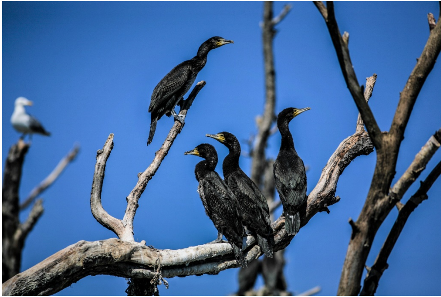
Vilande skarvar.

Av 27 § jaktförordningen framgår att jakt ska bedrivas så att viltet inte utsätts för onödigt lidande och så att människor och egendom inte utsätts för fara. I fråga om vilda fåglar är det, enligt 10 a § jaktförordningen, förbjudet att för fångst eller dödande använda medel eller metoder som anges i bilaga 5 till jaktförordningen eller andra medel eller metoder som inte är selektiva och som lokalt kan medföra att populationen av arten försvinner eller utsätts för en allvarlig störning.