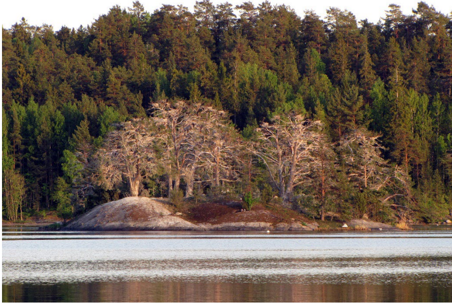
Holme med skarvkoloni.

Gädda och gös har liknande reglerande funktion av näringsväven som abborren. Även dessa arter har försvunnit från betydande delar av sina tidigare förekomstområden i skärgården. De har dock större krav på sin livsmiljö och har även historiskt levt i mer begränsade delar av skärgården än abborren. Samtliga bestånd av gädda och gös är idag svaga och känsliga för störning av fiske och predation.