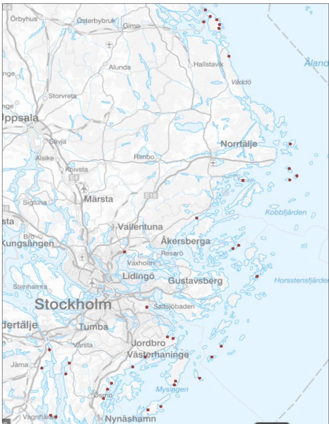
Fig. 3 Geografiskt läge för de redan gällande fredningsområdena: lekområden för vårlekande fiskar och öringåars mynning. För mer detaljer se Länsstyrelsens Fiskeguide .